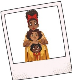
Los hijos (= les enfants)

La hija mayor (= la fille aînée) El ..... (= le fils cadet / plus jeune)