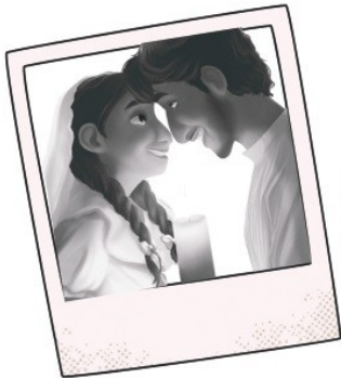
Los abuelos (= les grands-parents)